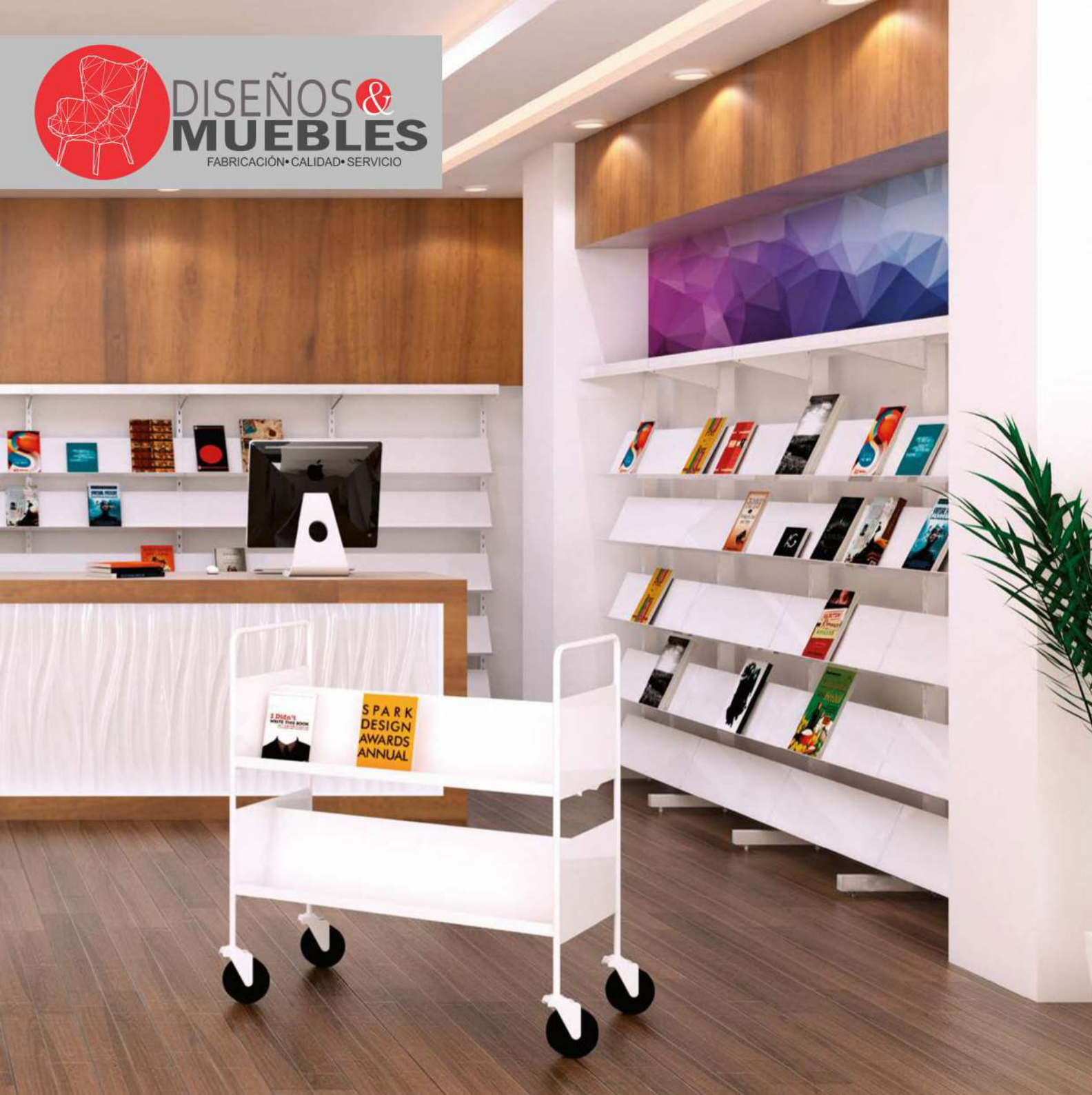
CARRO TRANSPORTADOR LIBROS